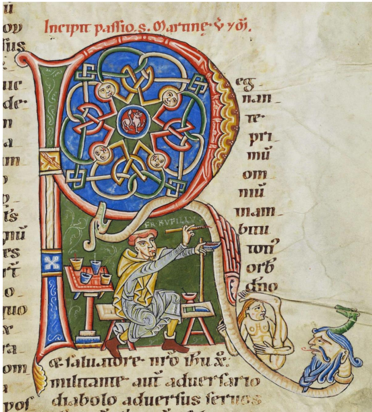
Der Buchmaler Rufillus im Weissenauer Scriptorium malt in die Initiale "R" sein Selbstbildnis, Ende 12. Jahrhundert.